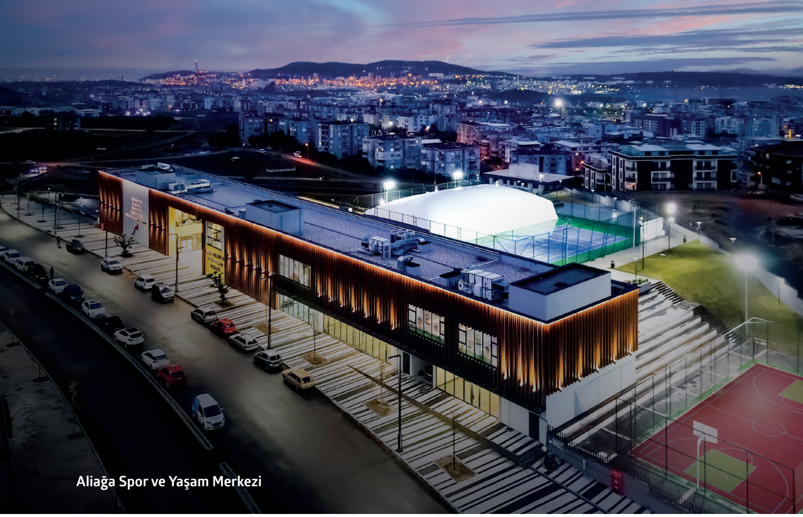
Aliağa Spor ve Yaşam Merkezi