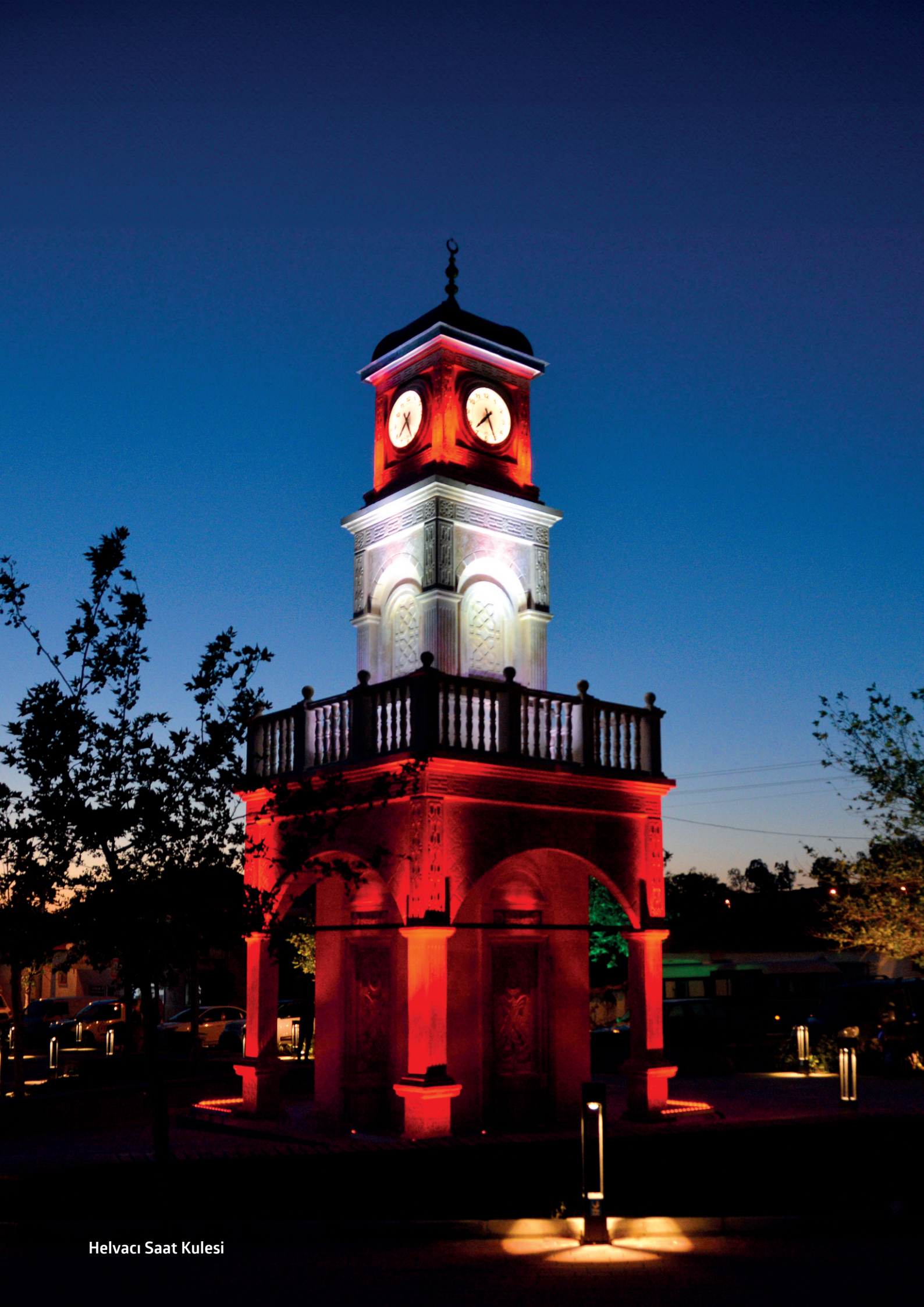
Helvacı Saat Kulesi