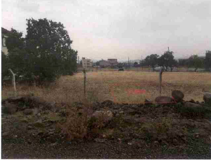
Şekil 1. Regülatör Alanı İçin Düşünülen Alandan Görünüm

Planlamaya konu alan, imar uygulaması görmüş ve kamuya terk edilmiş niteliktedir.