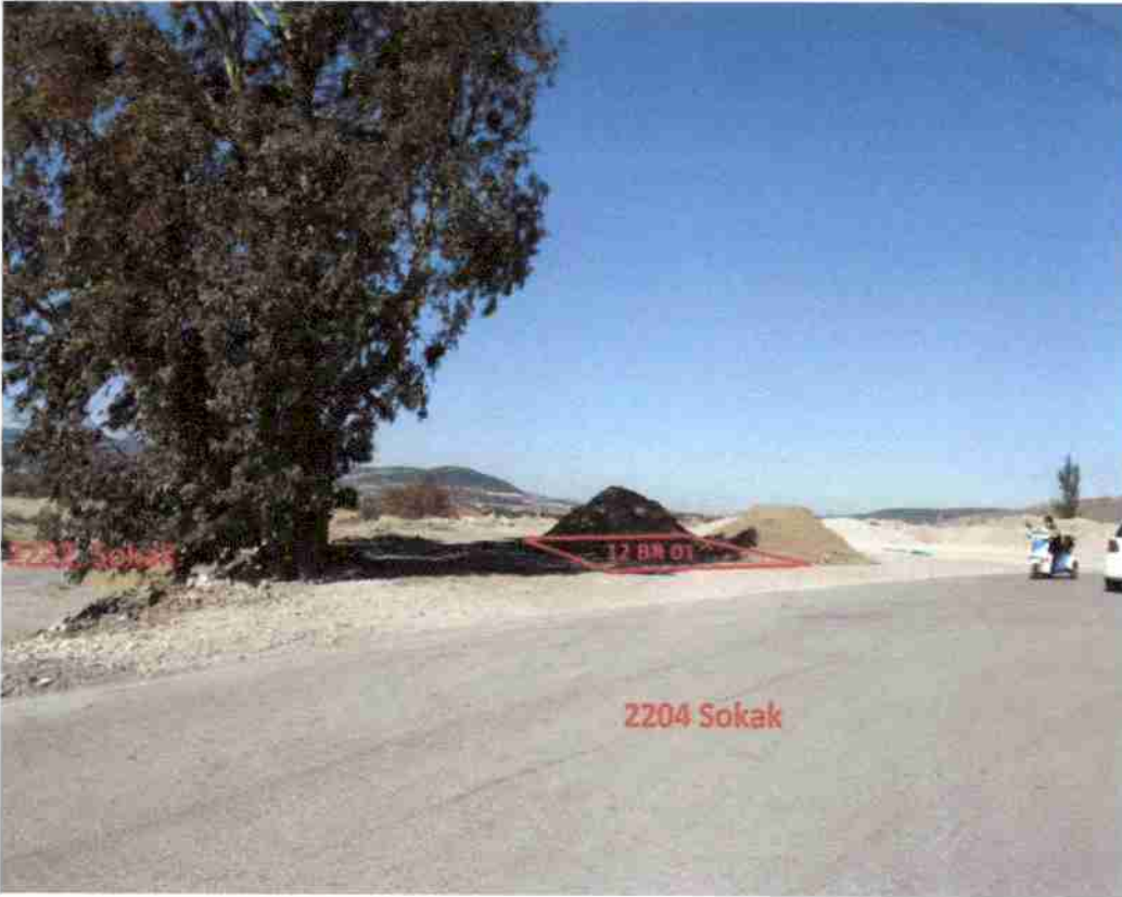
Şekil 1. Regülatör Alanı İçin Düşünülen Park Alanından Görünüm

Planlamaya konu alan, imar uygulaması görmüş ve kamuya terk edilmiş niteliktedir.